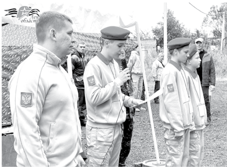
Сборы юнармейских отрядов «Валимский рубеж»

Поддержка некоммерческих организаций в Ленобласти выходит на новый уровень. Неравнодушные ленинградцы могут получить до 4 миллионов рублей на реализацию проекта своей мечты. Это стало возможным благодаря системе грантов губернатора в 2023 году на поддержку социальных инициатив выделено 189,5 миллиона рублей, что на 10% больше, чем годом ранее.