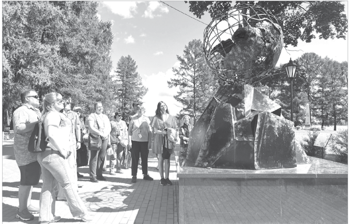
Туристы на экскурсии в сквере Корабелов

сии. Каждый турист, знакомясь с Присвирием, видит одного экскурсовода, который не только увлекательно рассказывает, но и отвечает за свою группу. Исключением является дополнительная встреча с экскурсоводами в музее, если это запланировано в программе. К чему я это всё? Да к тому, что от подготовки каждого гида зависит тот объем информации, то впечатление, которое получит турист, ведь это общение – единственная возможность узнать о новом уголке нашей необъятной страны. Не секрет, что главным является не только количество ин-