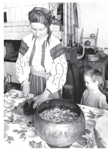
Волосовский район развивает агротуризм

раллельно читают лекции об истории Великой Отечественной войны. В Ломоносовском районе на средства гранта ресурсный центр «Профи» привлекает местных пенсионеров к нескудным мероприятиям и культурной жизни. Фонд «Ангел надежды» в Кингисеппе обеспечил детей-инвалидов доступом к редким тренажёрам