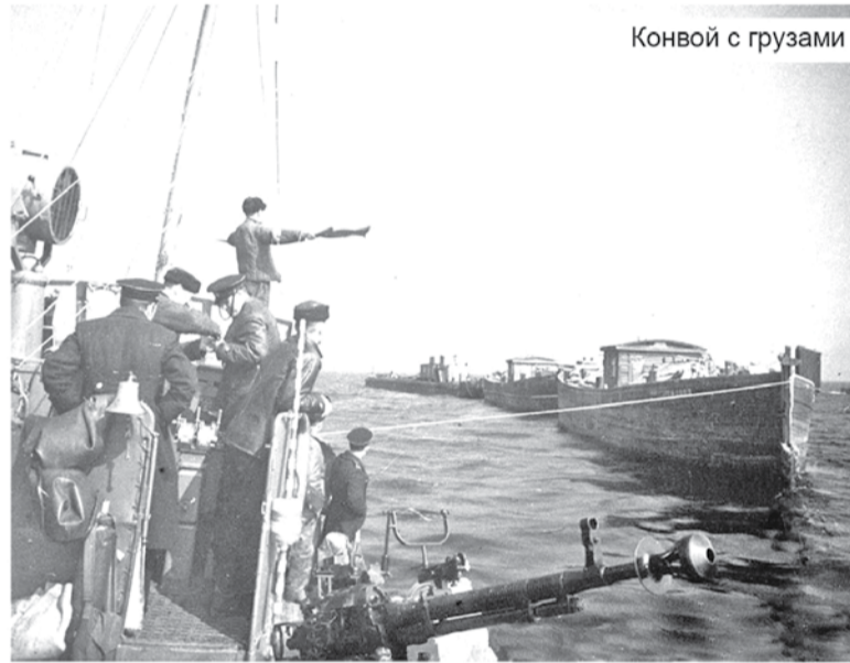
Конвой с грузами

Не менее важно было добиться максимального ускорения оборачиваемости флота. Для этого требовалось в первую очередь осуществить реконструкцию и