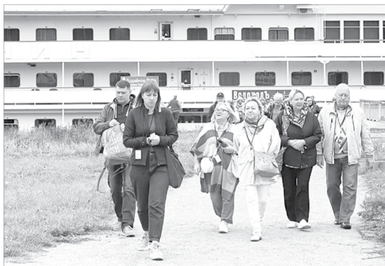
Экскурсоводы встречают гостей у водных ворот города

Мы, гости теплохода «Леонид Соболев», были приглашены на автобусную четырехчасовую