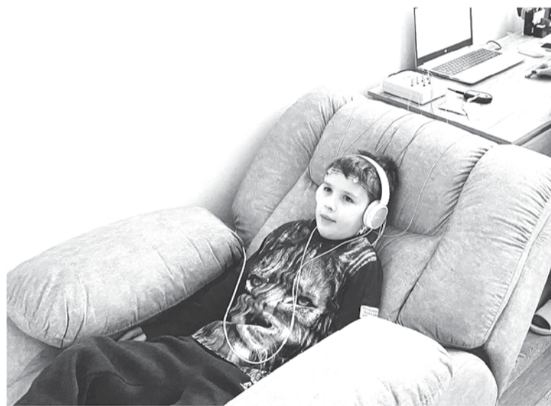
Кабинет реабилитации от фонда «Ангел надежды»

Три ключевых направления конкурса в этом году — развитие туристического потенциала региона, поддержка просветительских проектов в рамках Года Команды знаний, форми-